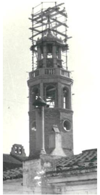
Campanar en construcció, 1959. Rajola de la sagristia del "Me Fecerunt" amb el rector, arquitecte i l'any.