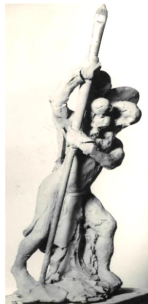
Esbós en fang de l'estàtua de St. Cristòfol. L'escultor amb la imatge dels Dolors (1954)