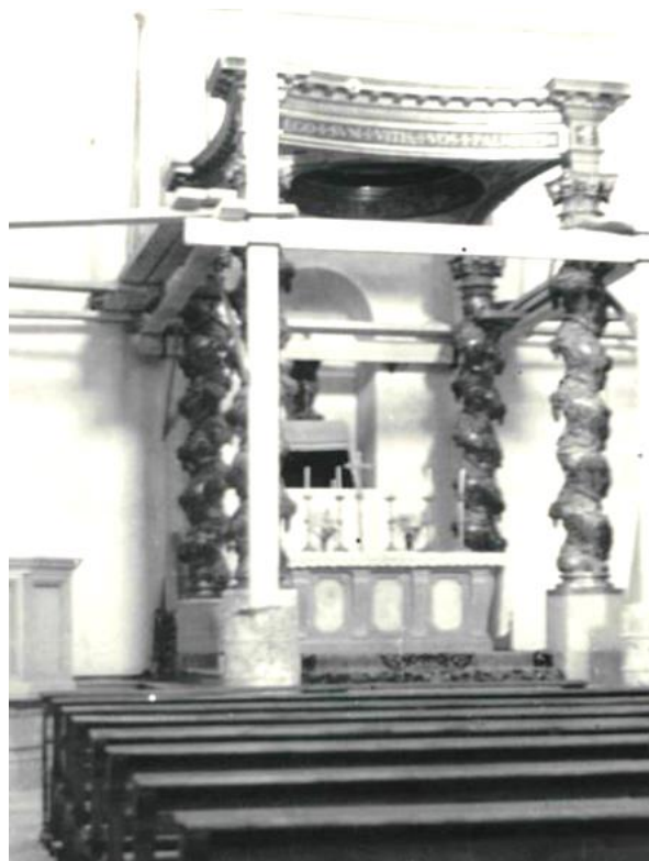
Col·locació de la base de la cúpula del Baldaquí (1951) El primer disseny del retaule de Bonet (1953)

RETAULE DE SANT CRISTÒFOL: Bonet va fer un primer esbós, que després modificà d'acord amb el definitiu que tenim ara: el sant és molt diferent, el fons de l'absis és ocupat per un retaule de línies elegants i severes, conté al centre la capella de Sant Cristòfol i el conjunt és daurat i policromat. El quadre superior que havia d'ésser una pintura de la Mare de Déu no es va fer perquè quedaria totalment tapat per la cúpula del baldaquí. Al fris que corona el retaule s'hi va col·locar una estàtua de mig cos del Pare Etern que no hi anava i els dos gerros superiors van ésser canviats per dos angelets 4 .